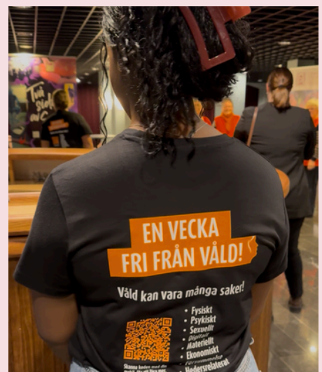
En vecka fri från våld